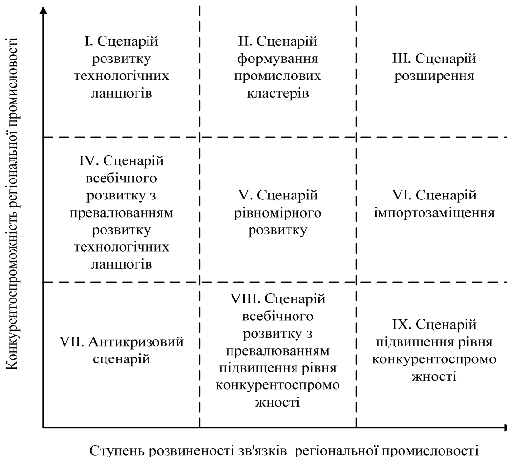
Рис. 2. Матриця вибору базового сценарію економічного розвитку промисловості регіону

За результатами визначення ступеня розвиненості внутрішньорегіональних зв'язків та проблеми конкуренції із зарубіжними виробниками формується матриця ситуацій і вибору базового сценарію (рис. 2).